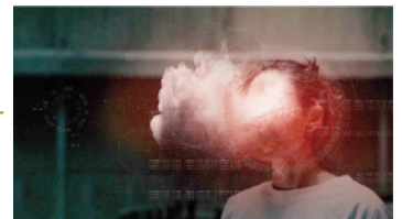
THE AUXILIARY – BIO-FICTION SCIENCE ART FILM FESTIVAL

Alone in front of her reflection in a collapsing world, someone desperate, feeling unfairly discredited, is going to end it all. But who is she and why?