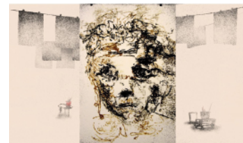
CARLOTTAS GESICHT – BIO-FICTION SCIENCE ART FILM FESTIVAL

Carlotta’s Face, 0:05, 2018, Germany, Valentin Riedl & Frédéric Schuld