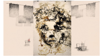
CARLOTTAS GESICHT - BIO-FICTION SCIENCE ART FILM FESTIVAL

Jahre später erfährt sie von einer seltenen, nicht behandelbaren neurologischen Erkrankung. Schließlich bietet ihr die Kunst einen Zugang, sich endlich selbst zu erkennen.